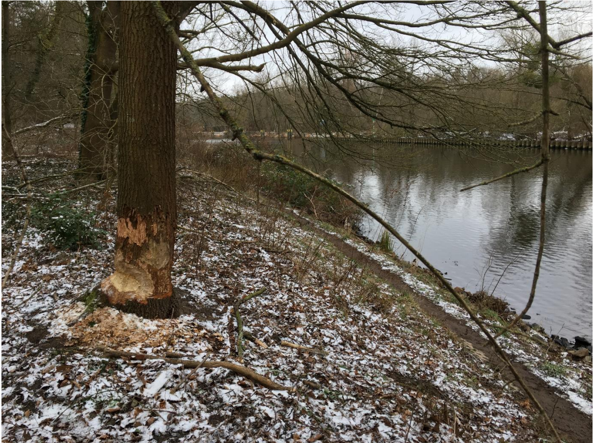
Ungeschützte Eiche am Teltowkanal, die vom Biber bereits massiv geschädigt ist.