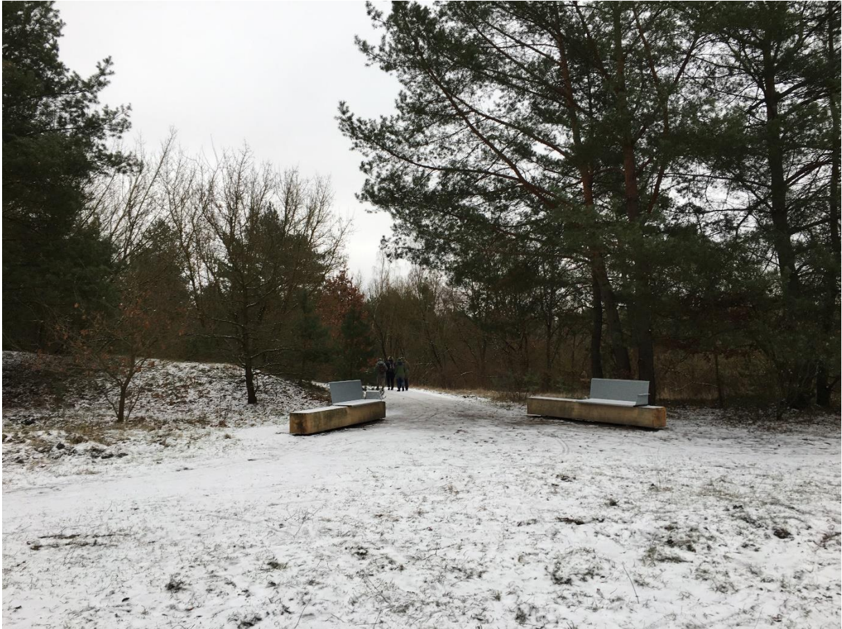
Eingang zum Radweg Richtung Stolperweg-Siedlung mit Sitzgelegenheiten aus Holz und Metall