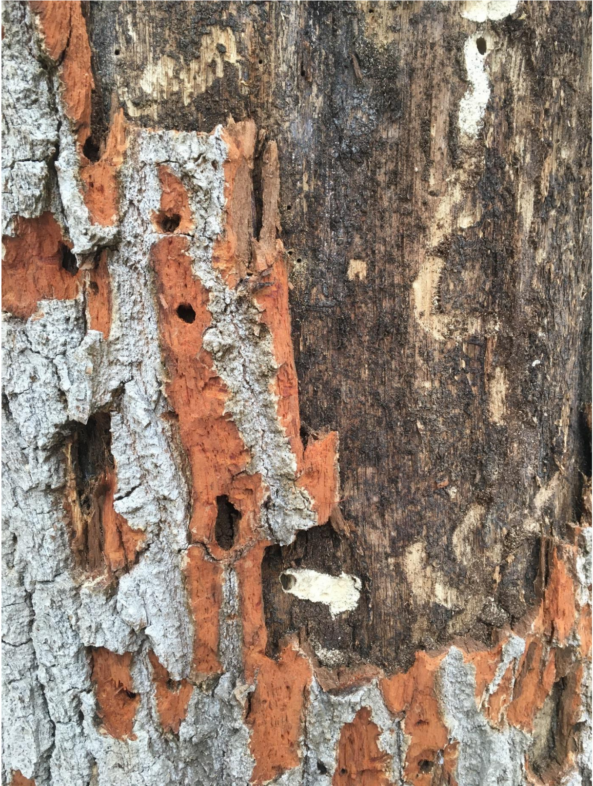
Schadbild von holzerstörenden Insekten an einem Eichenstamm, wahrscheinlich Eichenbock