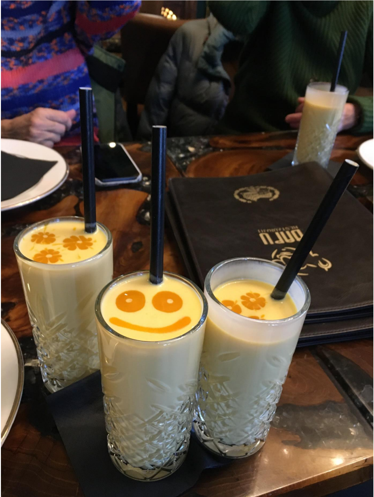
Mango-Lassi bei Bapu am 4.1.2025, zur Nachahmung empfohlen.