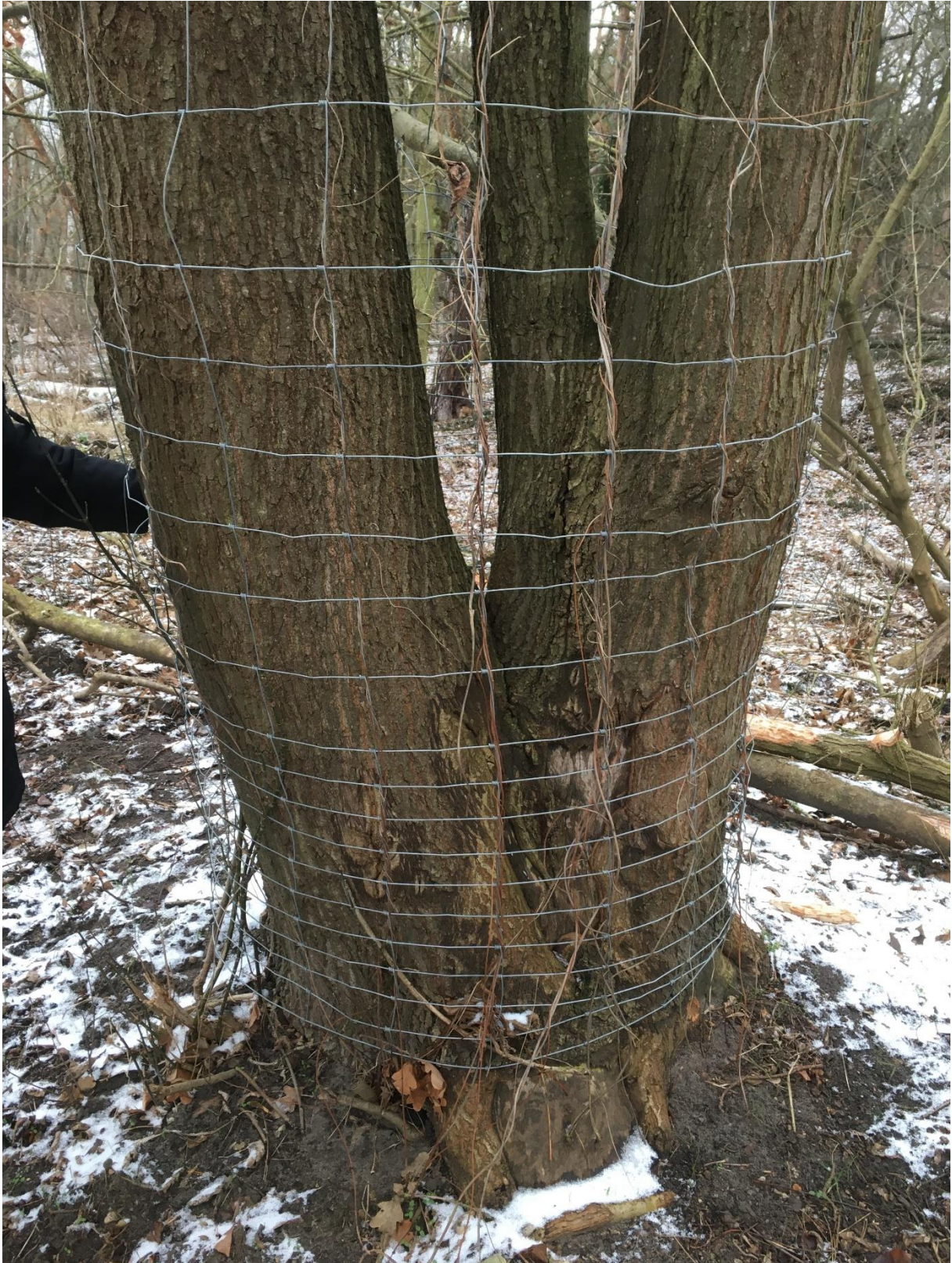
Baumschutz für eine benagte Eiche, wahrscheinlich von Mike Mittelstädt, WSD, angebracht.