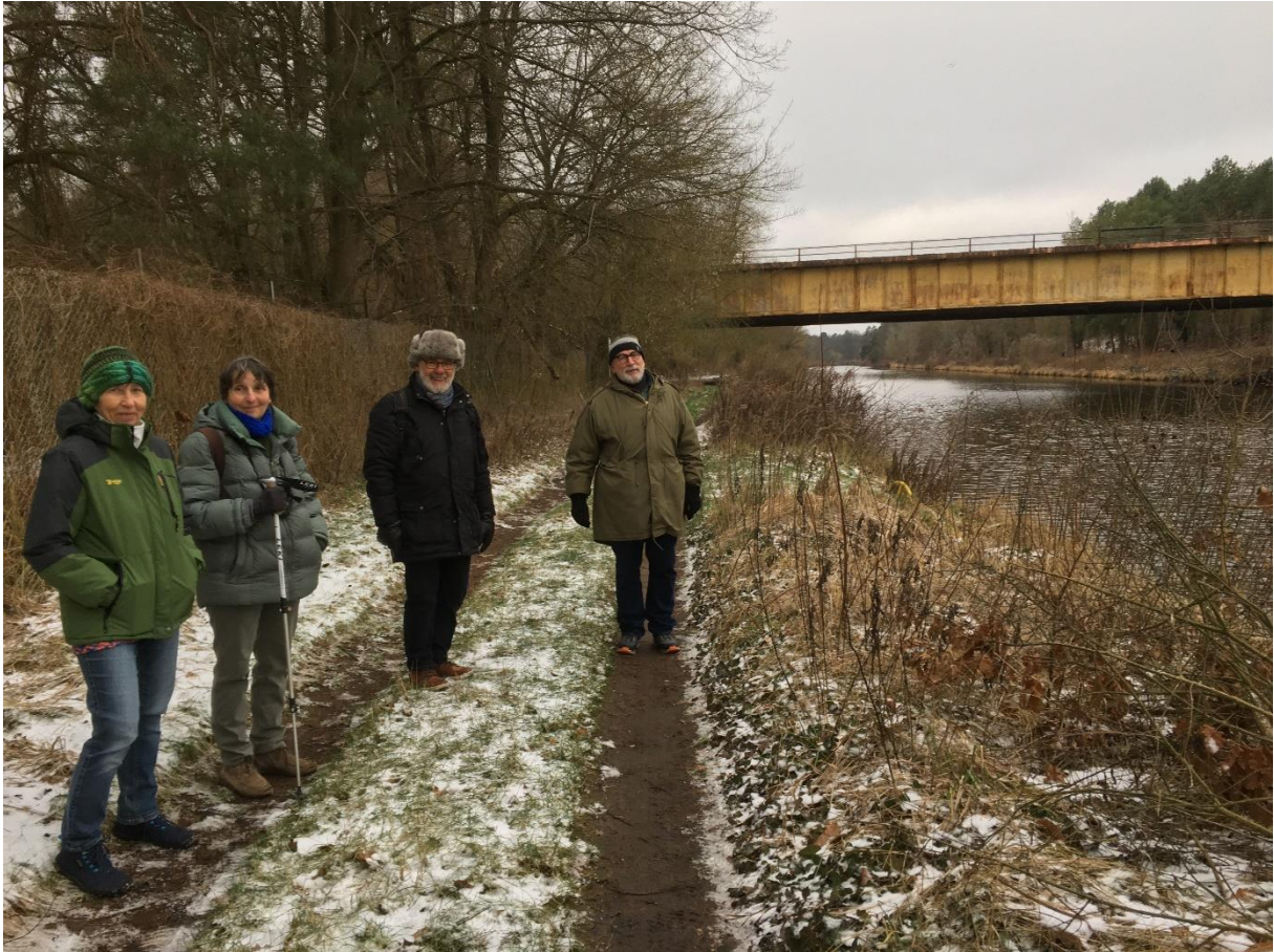
Vor der alten Autobahnbrücke, auf der seit 1968 eine Mauer stand.